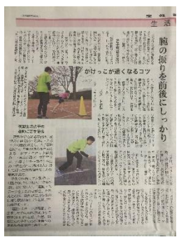
←3月19日の産経新聞でかけっこのコツが掲載されました。